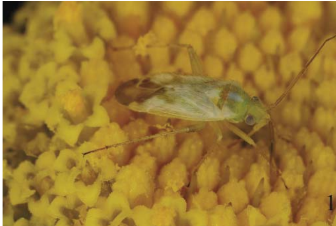
Figs. 1-2. Male (1) and female (2) of Megalocoleus naso (REUTER, 1879)